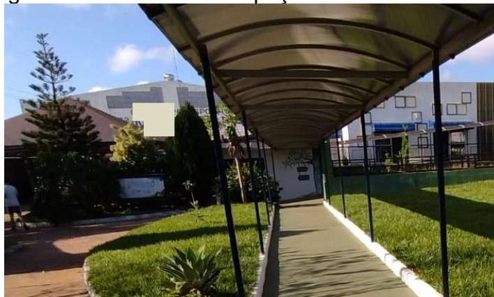
Figura 3 – Área verde e espaço arborizado da escola

O contato com a natureza através das atividades realizadas na instituição oportunizou a experiência inclusiva das crianças com foco na observação, notou-se que neste espaço (figura 3) elas se demonstraram mais tranquilas, participativas e mais interessadas ao que lhe estavam sendo proposto que no ambiente formal de sala de aula. A partir da realização dessas ações e a vivência em espaços não formais, mediante ao contato prático com o objeto de estudo, contribui para o ensino.