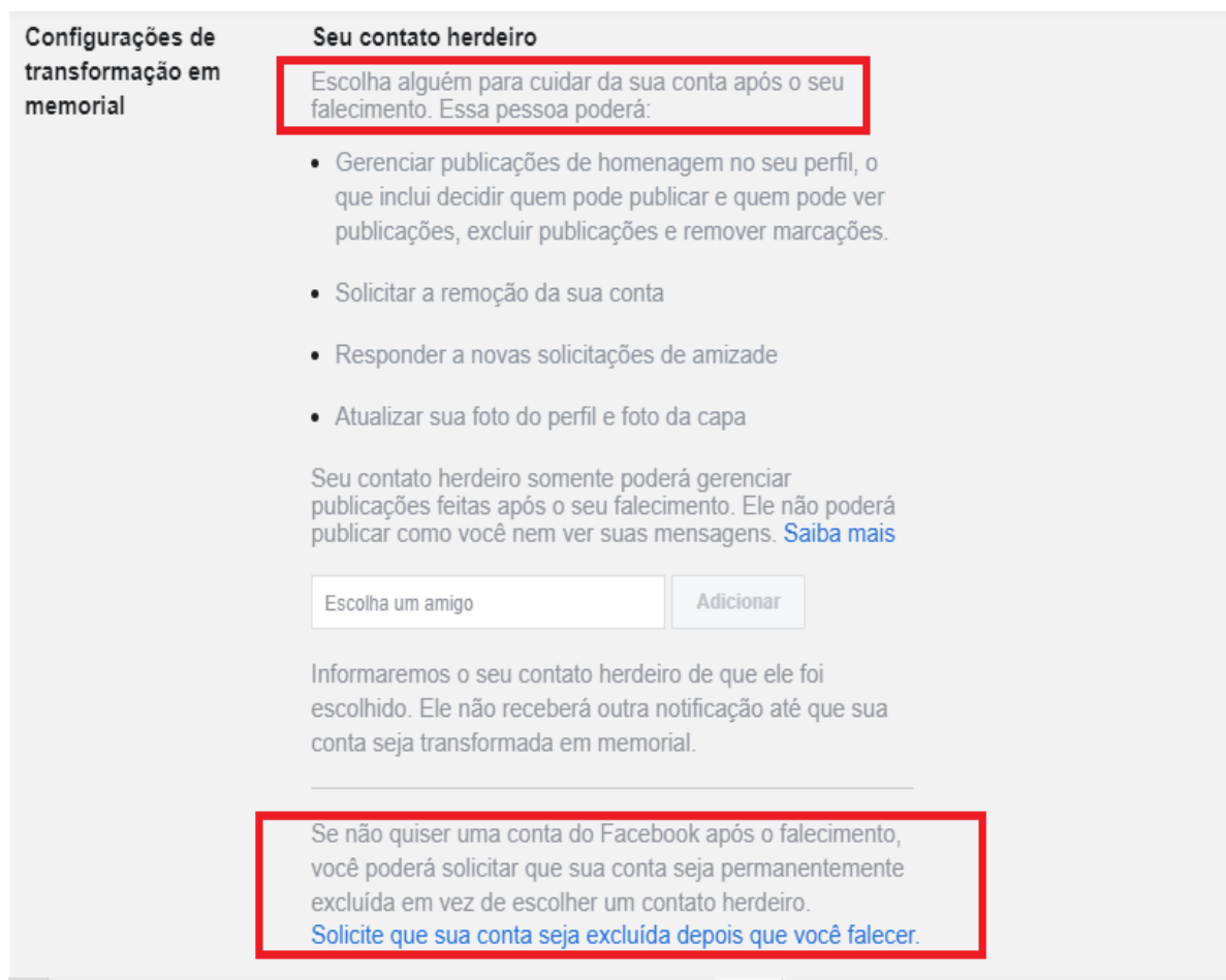
Figura 2 - As opções de finalidade da conta do Facebook