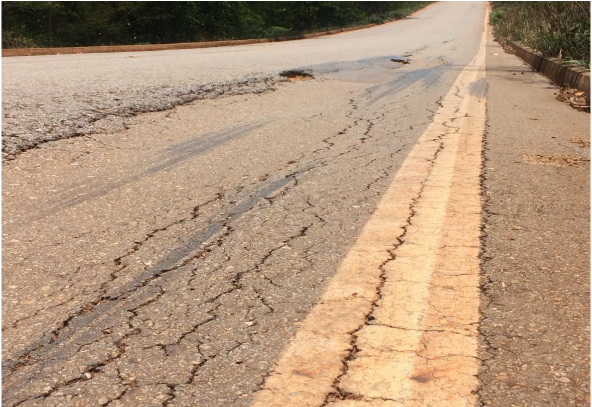
Figura 6 – Afundamentos G0-154