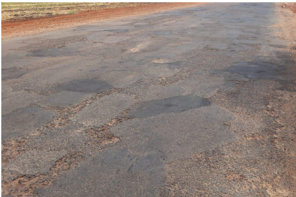
Figura 8 – Remendo G0-334

Remendo Profundo: a verdadeira causa do defeito deve ser previamente determinada antes da execução do reparo. Os reparos devem ser feitos para corrigir a causa do defeito e evitar ou retardar sua recorrência. Devem ser tomados cuidados para não permitir que estes reparos, no mesmo local, se tornem constantes. ARTERIS ES 013- Rev3.