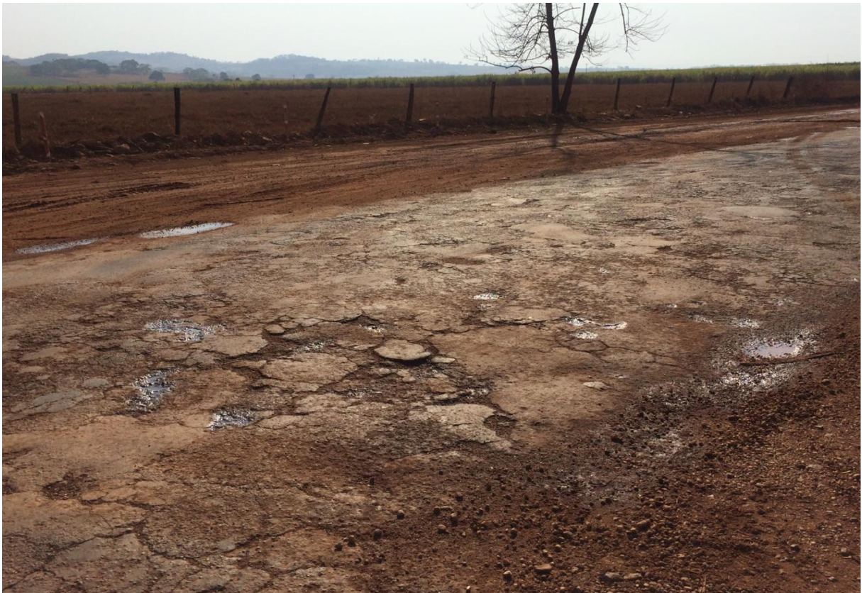
Figura 5 – Trincamentos G0-334