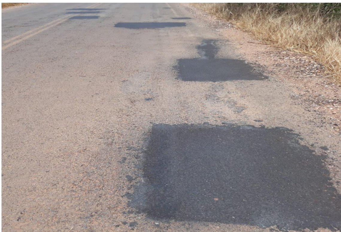
Figura 4 – Pré-misturado a frio