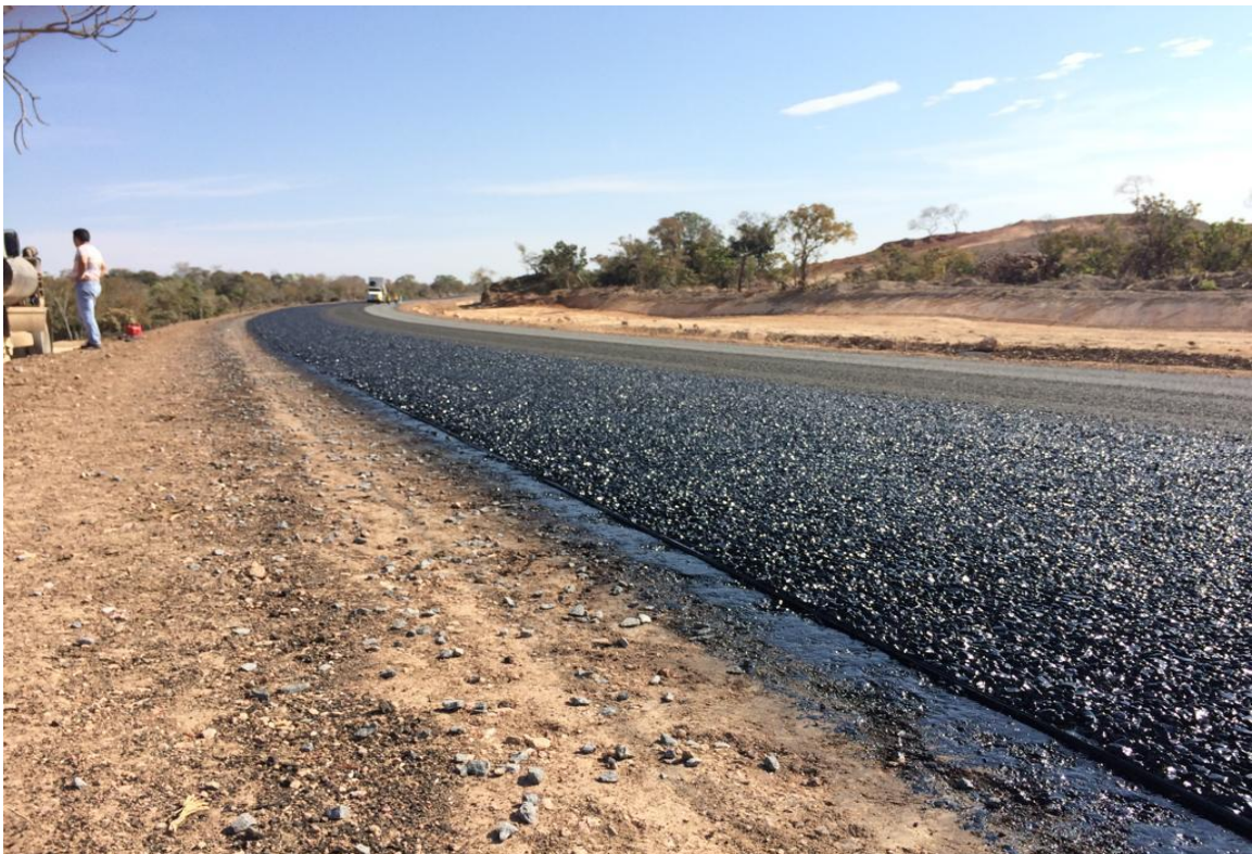
Figura 3 – Tratamento superficial duplo