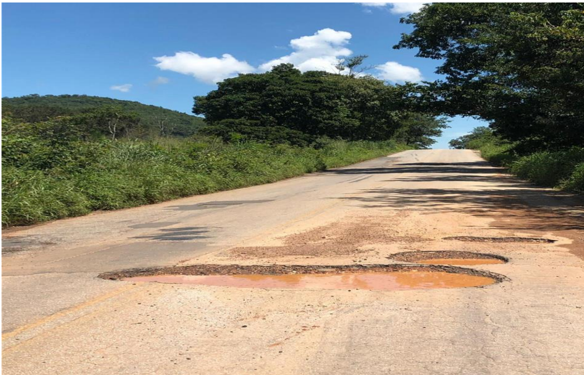
Figura 7 – Buracos G0-156