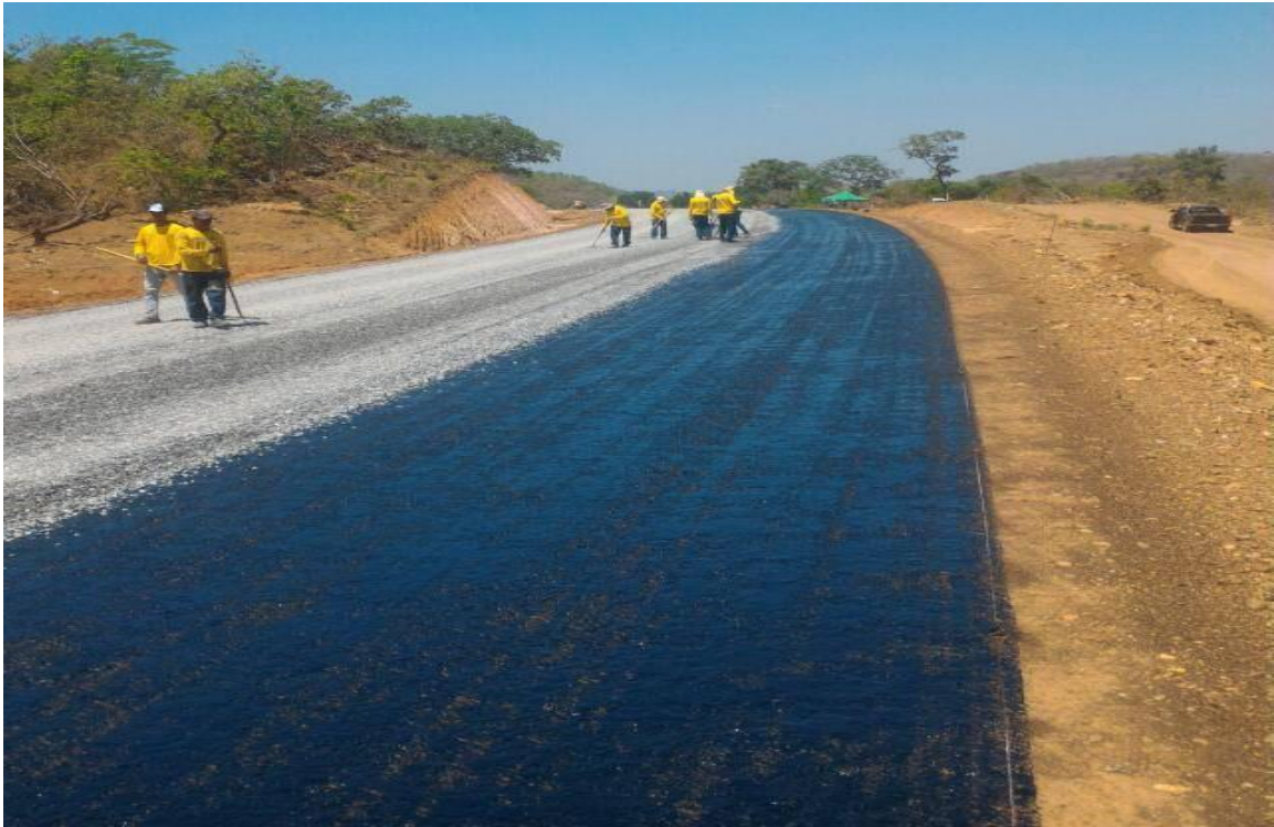
Figura 2 – Imprimação e primeira camada de brita